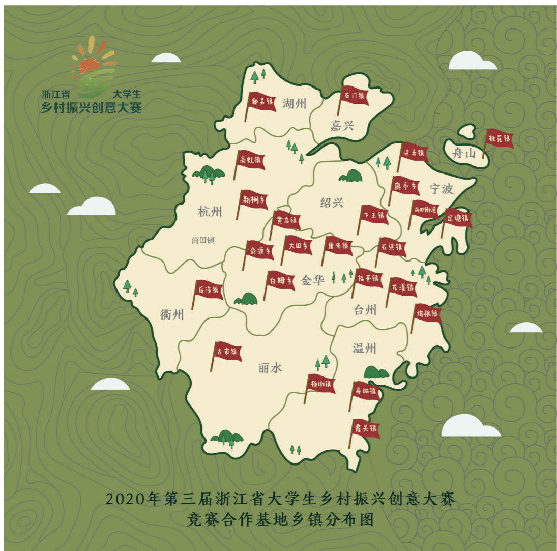
“农信杯”第三届浙江省大学生乡村振兴创意大赛 竞赛合作基地乡镇分布图